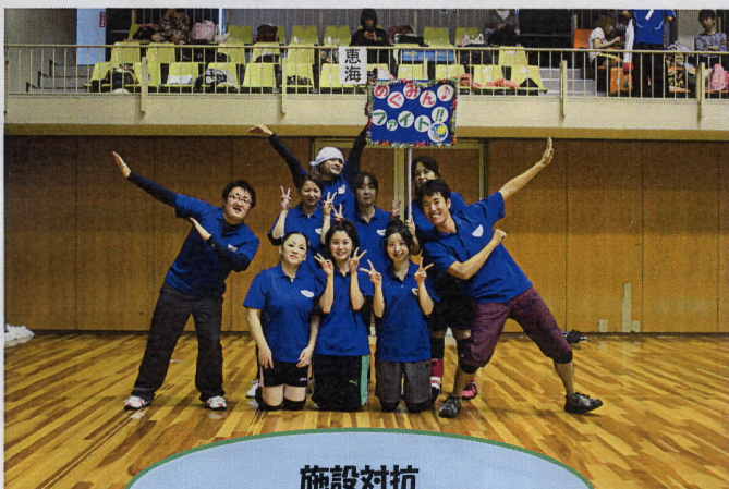
施設対抗 レクバレーボール大会